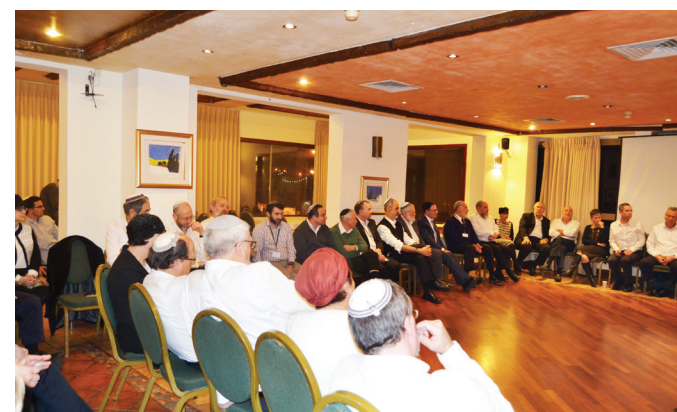
בבעלי מחלות נפש בקהילה ובקושי שבהתמודדות עם בעיות נפש בציבור בכלל ובחברה הדתית בפרט.

נושא נוסף שבו דן בית המדרש היה סוגיית צער בעלי חיים בשחיטה. בהקשר זה קיבלנו סקירה מקיפה על ידי מומחה בנושא,