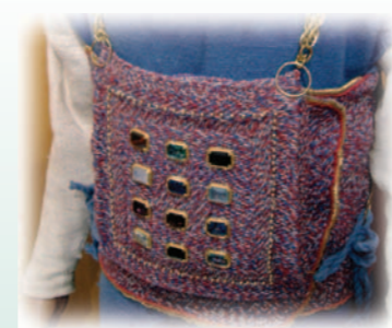
ה"חושן" כפי שנעשה ב"מכון המקדש".

נאמר בתורה (שמות כח, טו-ל): "ועשית את חושן המשפט... ונתת אל חושן המשפט את האורים ואת התומים והיו על לב אהרון". פשט הפסוק מלמד שה"אורים ותומים" הם דבר נפרד מהחושן, והם ניתנים לתוכו. אולם, אין בתורה ציווי על עשייתם, ואין תיאור שלהם בפסוקים. בדברי המפרשים יש שלוש שיטות מה הם ה"אורים ותומים": א. רש"י – ה"אורים ותומים" הם קלף, ועליו כתוב שם ה' המפורש. הקלף הונס בין קפלי החושן. אבן עזרא (שמות כח, ו) מקשה על כך מלשון הכתוב: "את האורים ואת התומים", ממנו נראה שהם שני דברים שונים, ולא דבר אחד. ב. אבן עזרא – ה"אורים ותומים" היו פיסות מתכת, מזהב וכסף, אותן היו שמים בתוך החושן. ג. רמב"ם (כלי מקדש טו, ואילך) – מתאר את עשיית החושן, ואינו אומר דבר על ה"אורים ותומים", או על קלף ובו שם ה' המפורש. מכאן וממקומות אחרים נראה שלדעתו, ה"אורים ותומים" אינם אלא אבני החושן עצמן. רבי אברהם בן הרמב"ם אומר, שאמנם מפשט הכתוב משמע, שה"אורים ותומים" הם חפץ אחר מלבד האבנים, אך מדברי הגמ' (יומא עג, ב): "למה נקרא שם אורים ותומים? אורים – שמאירים את דבריהם. תומים – שמשלימים את דבריהם" משמע, שה"אורים ותומים" הם תארים לאבני החושן המאירות.