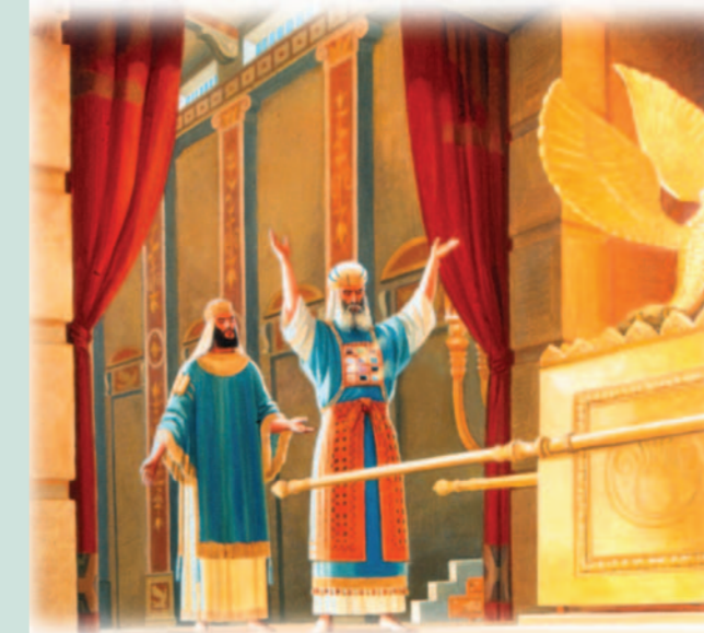
בציור נראים המלך והכהן הגדול, בעת שאלה ב"אורים ותומים". הסדר דלעיל הוא עפ"י שיטת הרמב"ם (כלי מקדש י, יא. ופירוש המשנה ליומא ז, ה) ולאחר ליבון הדברים עם הגאון הר' יוסף קאפח זצ"ל.

נאמר בתורה (במדבר כז, כא): "ולפני אלעזר הכהן יעמוד ושאל לו במשפט האורים לפני ה', על פיו יצאו ועל פיו יבואו, הוא וכל בני ישראל אתו וכל העדה". הגמרא ביומא (עגא) מבארת, שבשעת השאלה, עומד הכהן הגדול ופניו כלפי שכינה, והשואל עומד כשפניו כלפי אחורי הכהן. לדעת הרמב"ם (הל' כלי המקדש י, יא) הכהן הגדול עומד בהיכל כשפניו כלפי הארון, והארון הוא "השכינה" האמורה. רש"י מפרש ש"השכינה" היא האורים ותומים עצמם, ונראה שלדעתו צריך הכהן לכופף את ראשו כלפי החושן. כמו כן נראה שלדעת רש"י, מעמד השאלה לא צריך להתקיים בהיכל דווקא. בתיאור תפילת חנה נאמר (שמואל א' א, ג) "וחנה היא מדברת על לבה". הגמרא (שם) לומדת מכך שהשואל אינו שואל בקול, ומאידיך אינו מהרהר בליבו. מהרמב"ם (שם) נראה, שהשאלה נשאלת באופן שרק השואל שומע את עצמו. ברם, ראשונים אחרים (ר' אליקים; תוס' ישנים) מפרשים, שעל השואל לשאול באופן שהכהן יוכל לשמוע את השאלה. תנאים נחלקו בגמרא (שם), האם בשעה שהכהן משיב את תשובת ה', צריך הוא להקדים לתשובתו את המילים "כה אמר השם". מסתבר שמחלוקתם היא, האם הכהן צריך להדגיש שתשובתו אינה מליבו, ולהדגיש שזהו דבר ה', או שאין צורך בכך, היות והדבר מובן מאליו. להלכה נפסק כדעה שאין צורך שהכהן יאמר "כה אמר ה'".