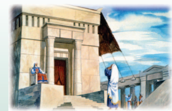
תפילת חנה התקיימה כאשר עלי הכהן הגדול ישב על הכסא, על מזוזה היכל ה'.