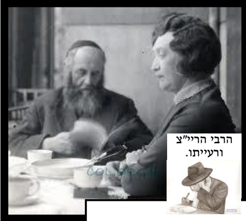
הרבי הרי"צ ורעייתו.

הטורמיסין איננו רק שבועון של כמה בחורי ישיבה, הטורמיסין הינו גישה אל החיים בכללם. גישה זו טומנת בחובה אמירה מאוד עמוקה. ראשית כל, הוצא את הדברים החוצה אפילו לא יהיו אלה הדברים הכי יפים או הכי מסודרים - תן להם לצאת, תאפשר להם להתקיים ולהתהוות - אל תחסום את עצמך. לרוב החידוש והחן מגיעים רק אחר שהדברים משתחררים ומקבלים קיום עצמאי, כך הם יכולים לפרוח ולגדול בעצמם. הדברים הללו כבר נאמרו באופן אחר ע"י ג'וליה קמרון ב'דרך האומן' (מספרי ר' חיים כפרי), צריך לתת לאמן הקטן שבכל אחד מאיתנו ביטוי כדי שיוכל ליצור. הטורמיסין הוא הבמה לדבר הזה, לאפשרות לסלול דרך חיים של יצירה ופירון.